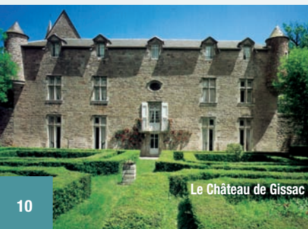
Le Château de Gissac

Saint-Guilhem-le-Désert, Sylvanès, Rodez, Conques, Saint-Jean-d'Alcas, La Couvertorade, Sainte-Eulalie-de-Cernon, Abbaye de Valmagne.